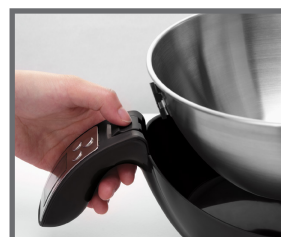
Tazón desmontable para facilitar su limpieza