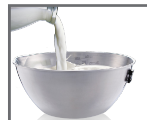
Tazón de acero inoxidable con graduación

SERVICIO Y REFACCIONES DISPONIBLES Contamos con una red de centros de servicio en toda la república: rhino.mx/servicio.html