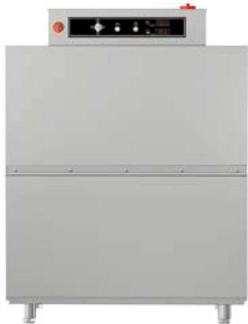
EASY-120 I CW