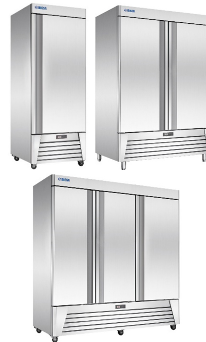
MODELOS UR-27F-1 | UR-54F-2 | UR-78F-3

MAQUINARIA INTERNACIONAL GASTRONÓMICA, S.A. DE C.V. HENRY FORD 257-H, COL. BONDOJITO, ALC. G.A.M. 07850, CDMX. 5517.4771 | 5739.3423